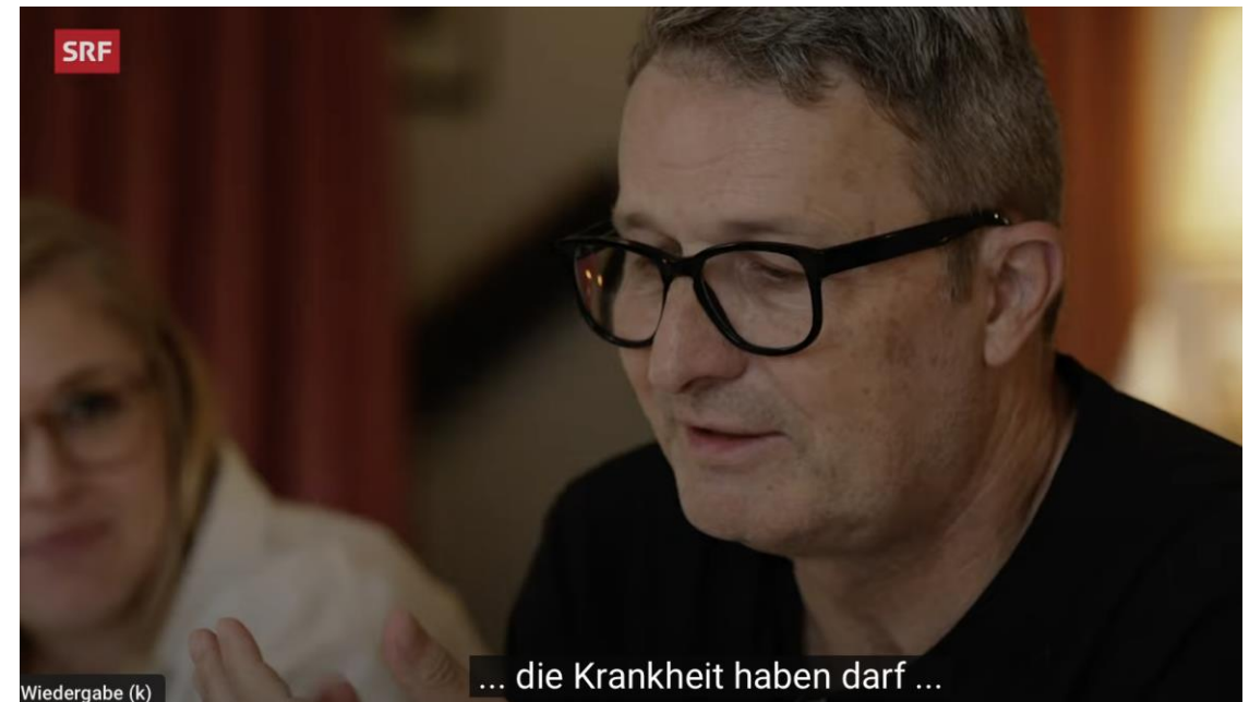
SRF Reporter: Alzheimer mit 56 Jahren