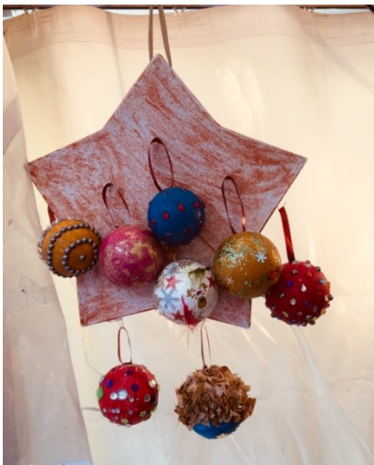
Boule de Noël et suspensoir confectionné par les patients du service des Rochers de l'hôpital de Malévoz pour notre marché de Noël

Les formations sont mises sur pied sur demande des différentes institutions. CMS, EMS...et sont données par des experts dans la prise en charge de la démence.