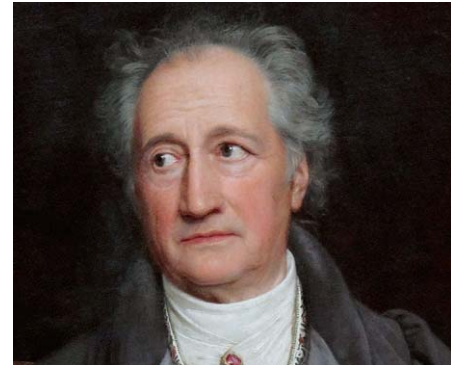
Johann Wolfgang von Goethe (1749 – 1832) liess Ginkgobäume pflanzen.

Der Baum heisst «Ginkgo biloba», weil das Blatt zwei Lappen hat. Lateinisch bi = zwei, lobus = Lappen.